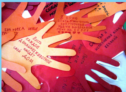
Даша Лодыгина, 7 «Б» класс

Будем надеяться, что все эти записи станут явью в 2017 году!